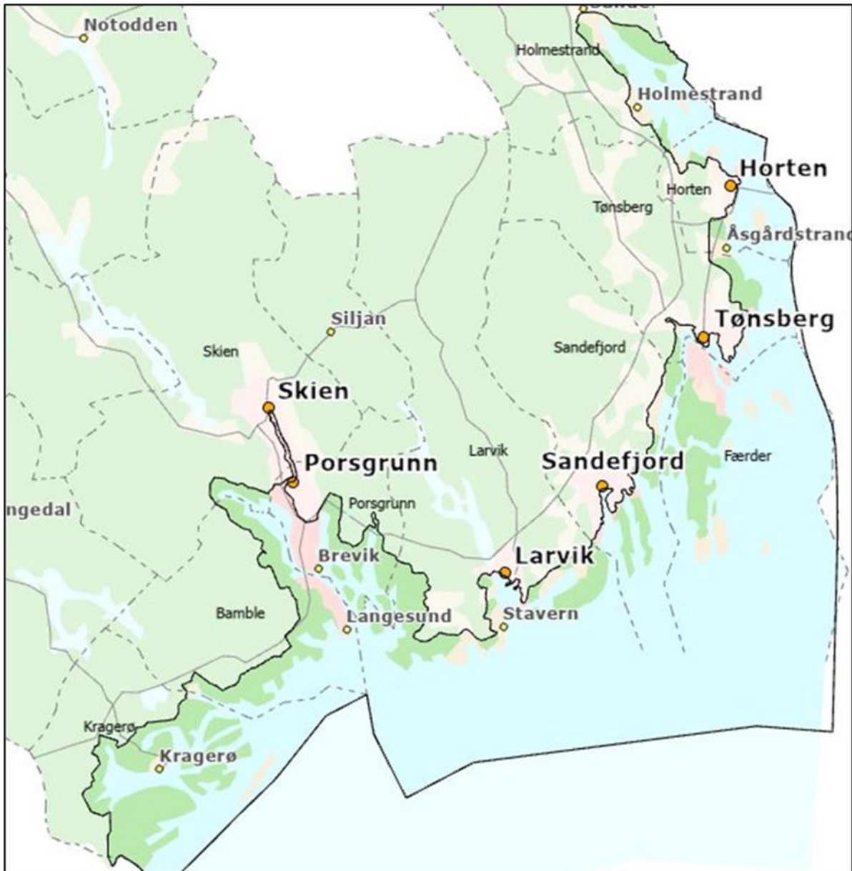
Figur 2: Planområdet